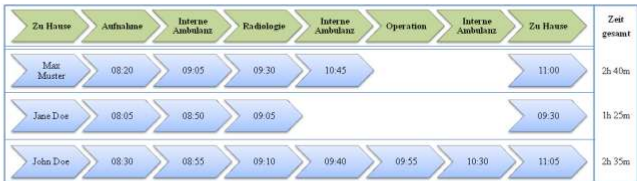
Abbildung 2: Darstellung von drei rekonstruierten Patientenpfaden

Vorgaben von IHE zu entsprechen, wurden bei der Entwicklung der Anwendung ausschließlich auf Connecthations getestete Softwarekomponenten eingesetzt. Die IHE Infrastruktur wurde von Tiani „Spirit“ GmbH zur Verfügung gestellt; Akteure die auf diese Infrastruktur zugreifen, basieren auf den quell-offenen Projekt OpenHealthTools2 .